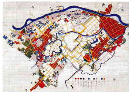
熊本総絵図 文久元年(1861)以降