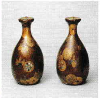
菊桐紋時絵螺細徳利(加藤清正所用) 桃山～江戸時代(16～17世紀)