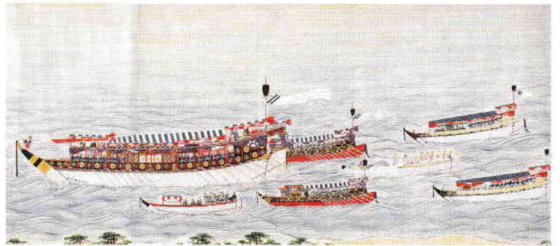
橋本又左衛門筆 御船賦之図 明治時代(19世紀)