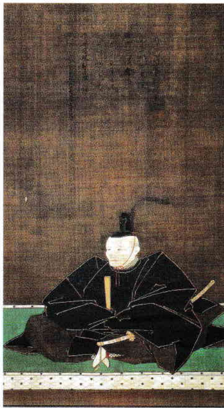
矢野三郎兵衛吉重筆・沢庵宗彭賛 細川忠利像 寛永18年(1641)【前期展示】

東京都文京区目白台1-1-1 TEL:03-3941-0850 http://www.eiseibunko.com/ [交通案内]JR目白駅(「目白駅前」バス停)・副都心線雑司が谷駅(「鬼子母神前」バス停)より、都営バス「白61 新宿駅西口」行きにて「ホテル椿山荘東京前」下車徒歩5分。都電荒川線早稲田駅より徒歩10分。有楽町線江戸川橋駅(出口1a)、東西線早稲田駅(出口3a)より徒歩15分。