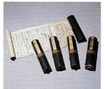
宮本武蔵筆・寺尾勝延書写 五輪書 江戸時代(17～19世紀)