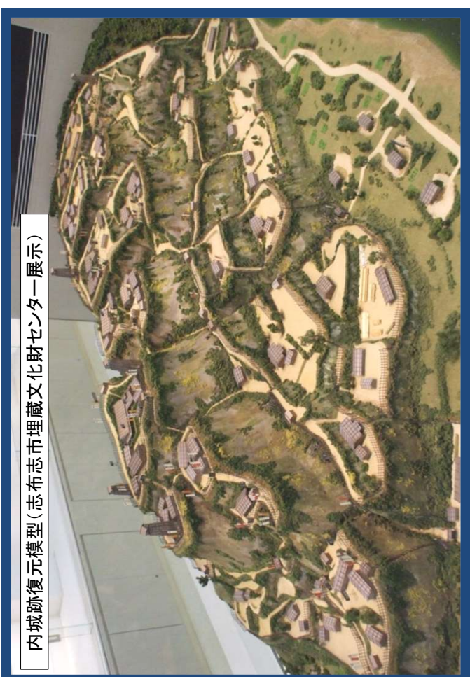
内城跡復元模型(志布志市埋蔵文化財センター展示)

志布志市教育委員会 生涯学習課 文化財管理室 電話 099-472-1111(代表)